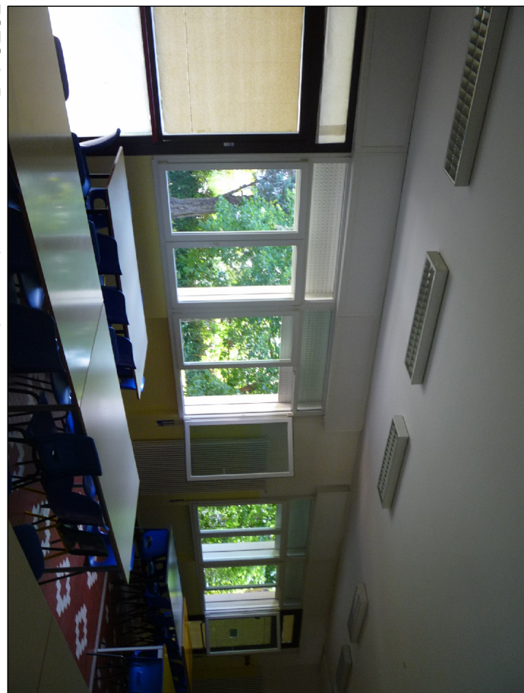
FOTO 9_Disposizione arredo non idonea