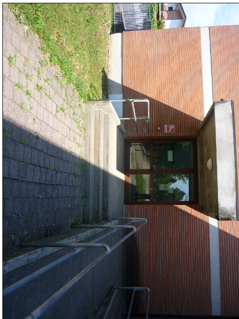
FOTO 12_Assenza segnaletica orizzontale