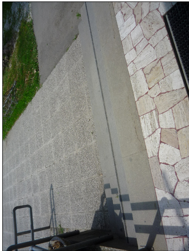
FOTO 2_Assenza di corrimano e mancanza segnal. orizzontale