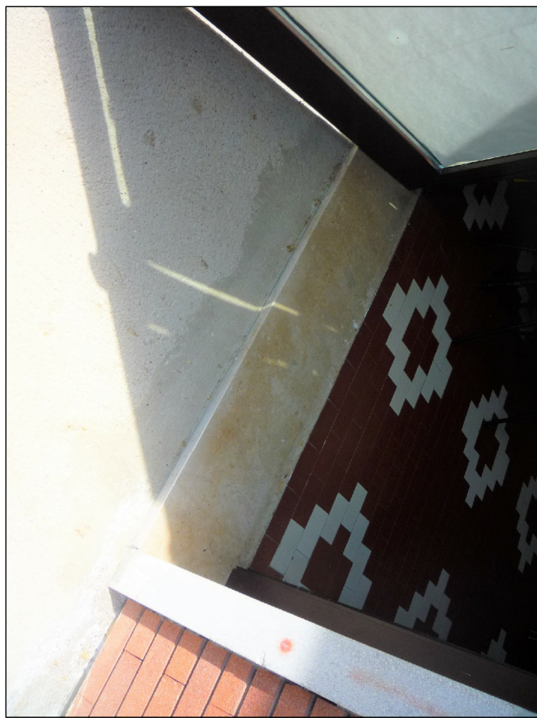
FOTO 11_Dislivello superiore a cm 1,5