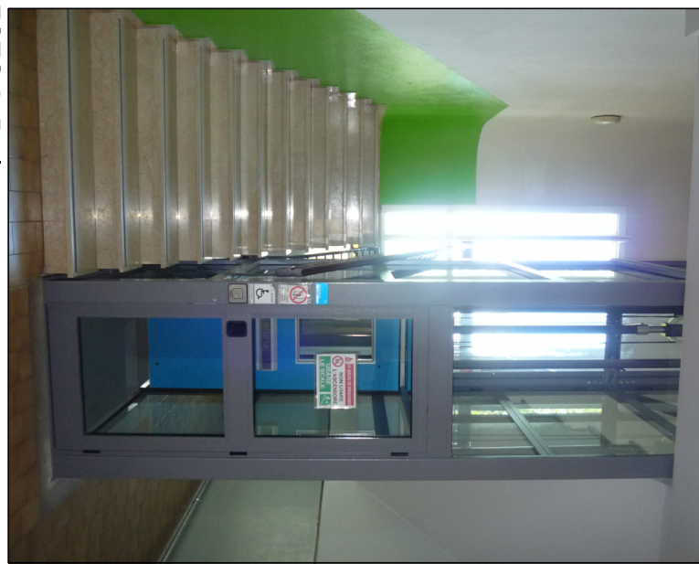
FOTO 8_Prolungamento corrimano e assenza segnaletica orizzontale