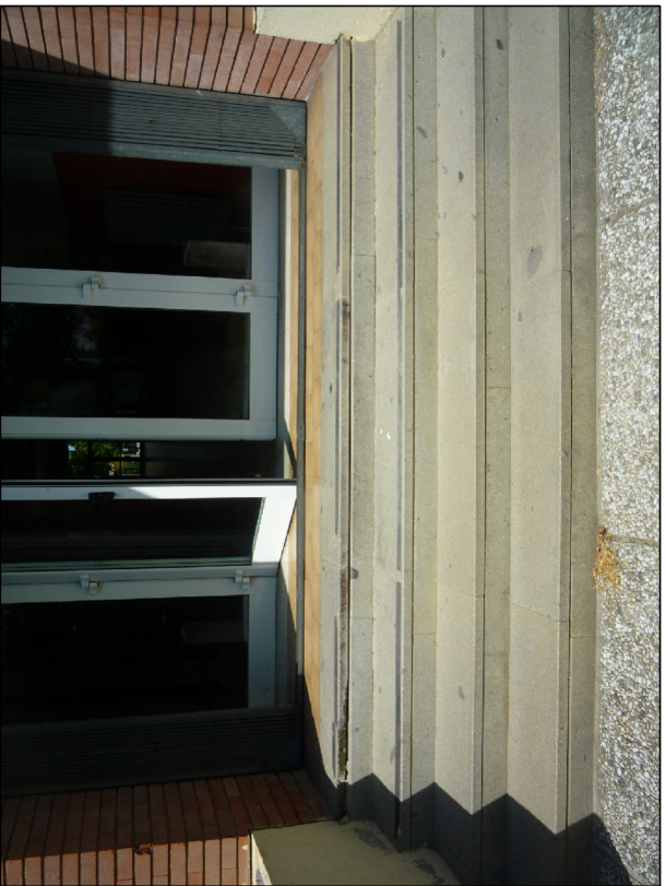
FOTO 5_Assenza percorso di collegamento