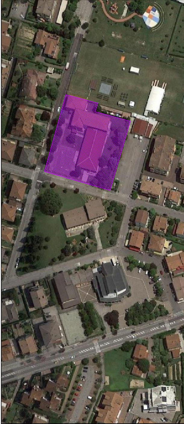
Foto oggetto di intervento