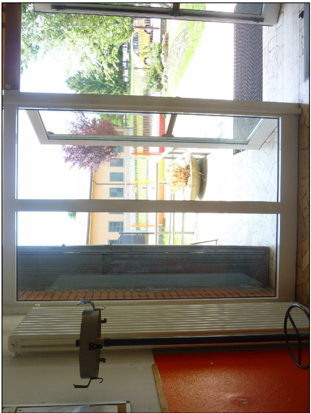
FOTO 3_Mancanza segnaletica orizzontale