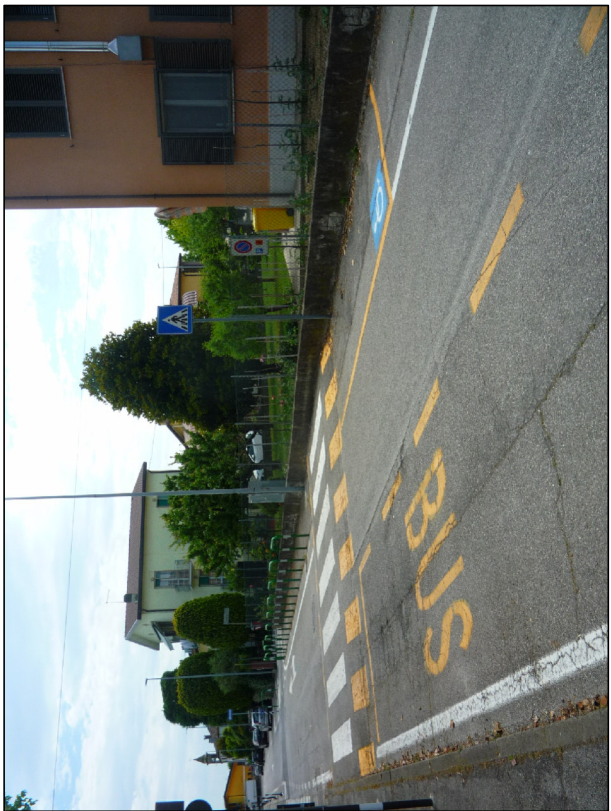
FOTO 1_Posizione non idonea parcheggio disabili