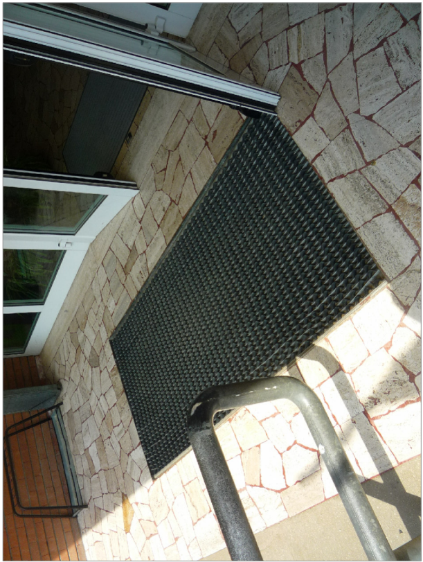
FOTO 2_Zerbino a raso da sostituire