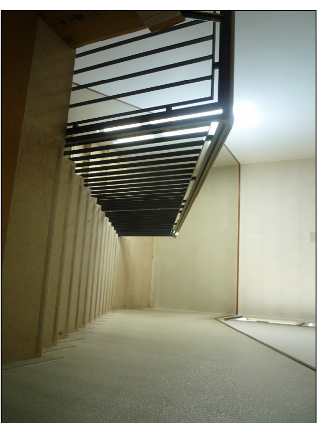
FOTO 14_Prolungamento corriman