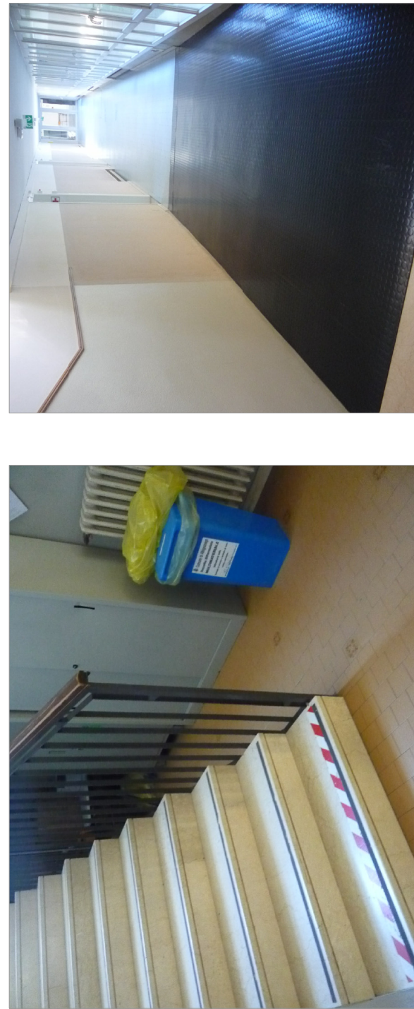
FOTO 10_Corrimano da allungare