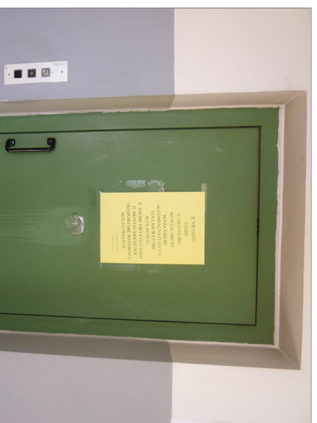
FOTO 17_Assenza segnaletica vertical