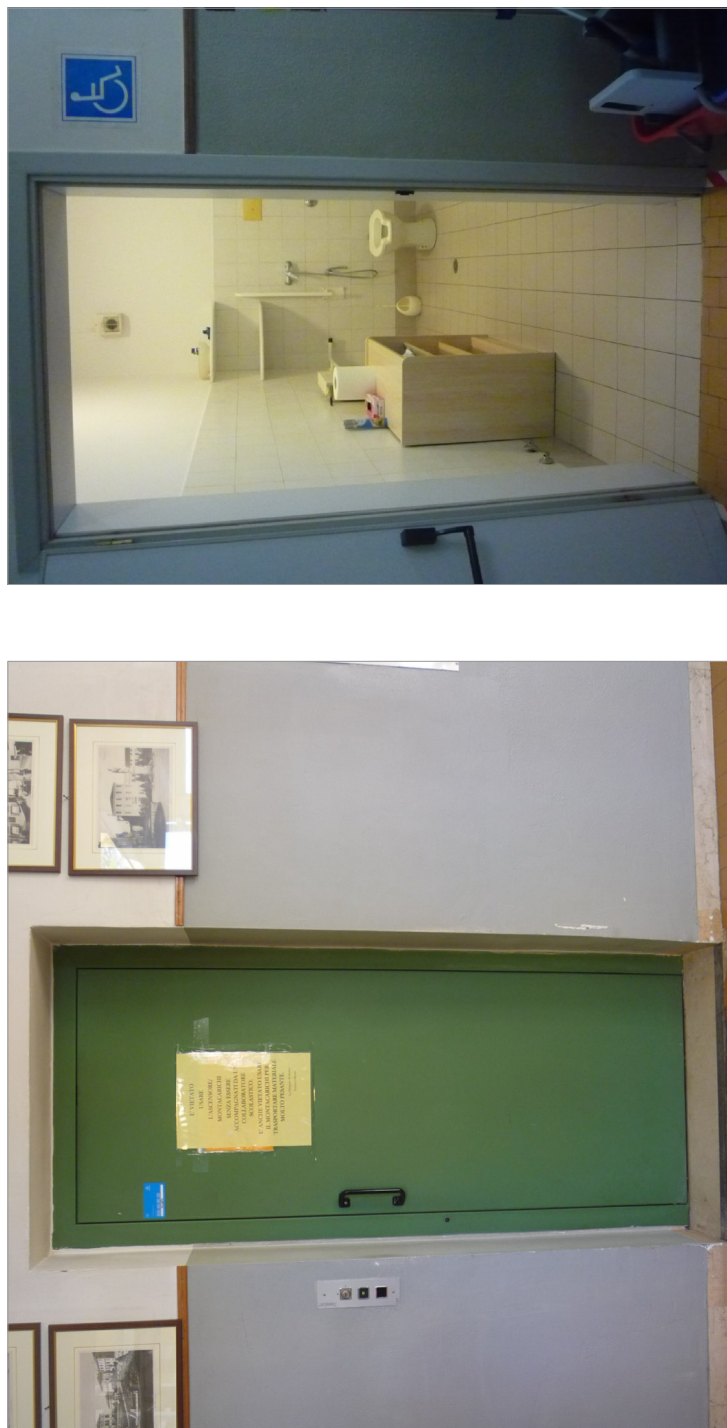
FOTO 11_Assenza segnaletica orizzontale