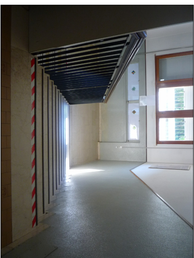
FOTO 15_Prolungamento corrimano