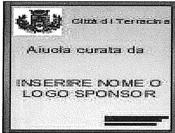
CARTELLO TIPO 3