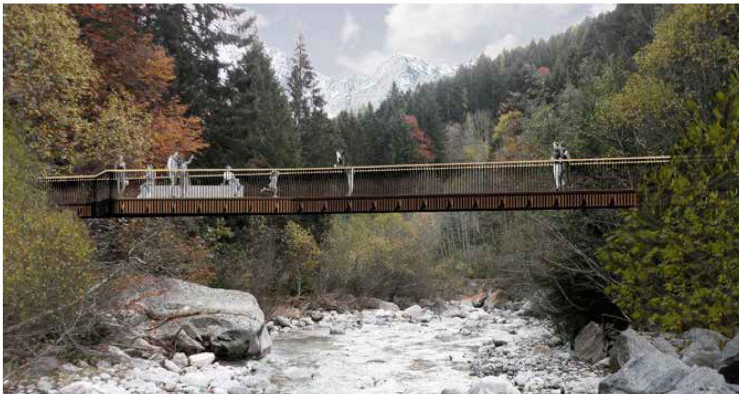
Fotoinserimento passerella Vista Est attraversamento torrente