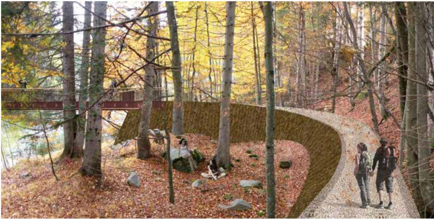
Vista dei luoghi in prossimità dell'attraversamento torrente in sponda Nord