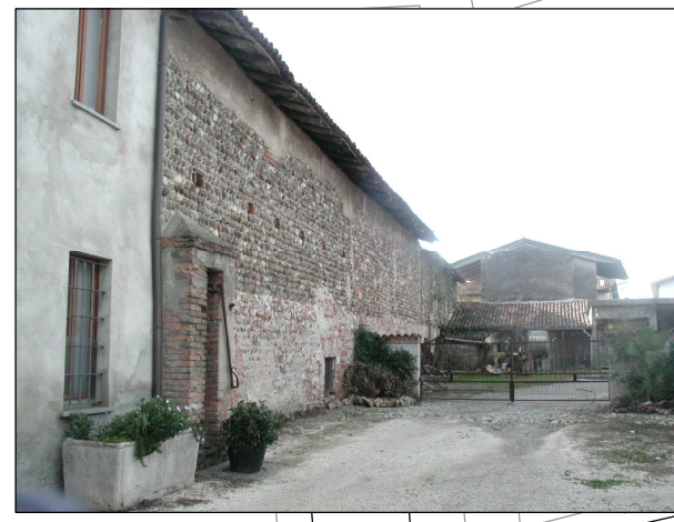
RIFERIMENTO FOTOGRAFICO 8