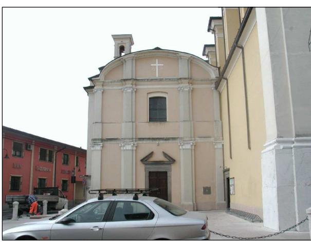
RIFERIMENTO FOTOGRAFICO 2