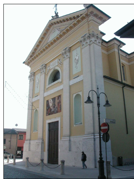
RIFERIMENTO FOTOGRAFICO 1