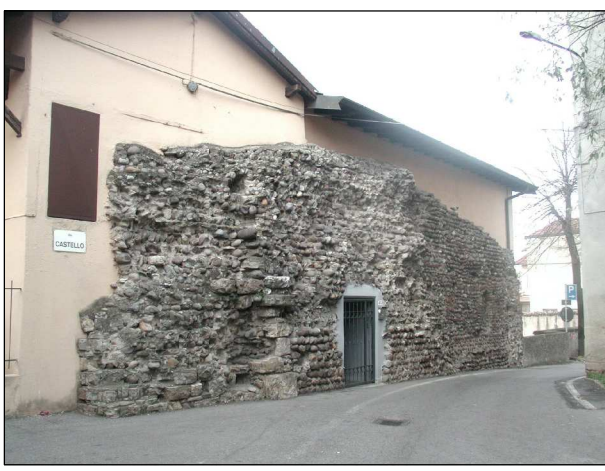
RIFERIMENTO FOTOGRAFICO 4