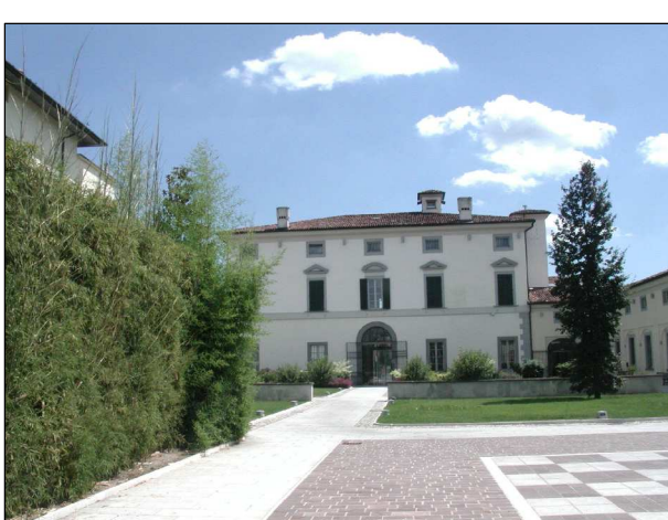
RIFERIMENTO FOTOGRAFICO 18