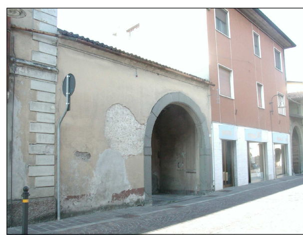
RIFERIMENTO FOTOGRAFICO 24