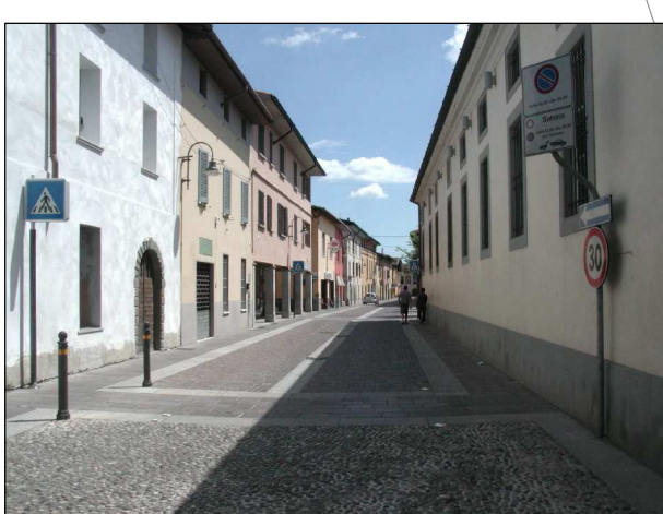
RIFERIMENTO FOTOGRAFICO 19