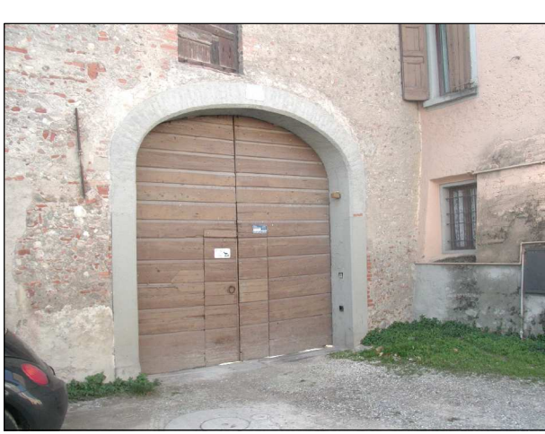
RIFERIMENTO FOTOGRAFICO 22