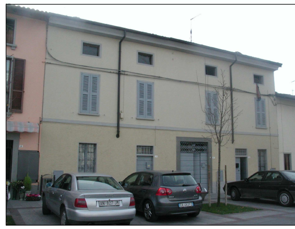
RIFERIMENTO FOTOGRAFICO 11