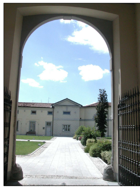
RIFERIMENTO FOTOGRAFICO 20