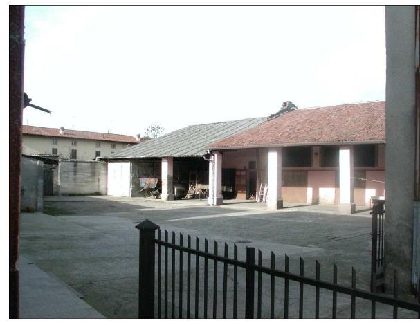
RIFERIMENTO FOTOGRAFICO 7