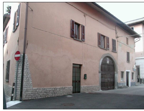
RIFERIMENTO FOTOGRAFICO 12