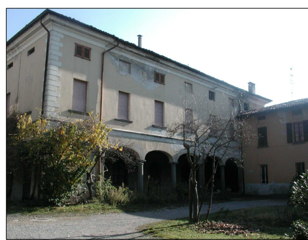
RIFERIMENTO FOTOGRAFICO 23