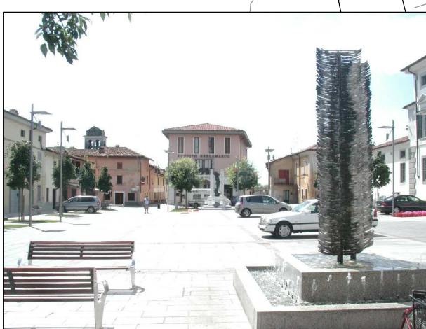
RIFERIMENTO FOTOGRAFICO 17