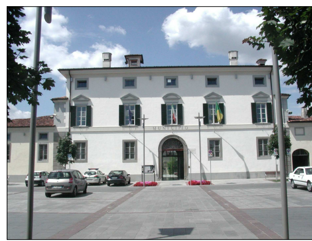
RIFERIMENTO FOTOGRAFICO 14