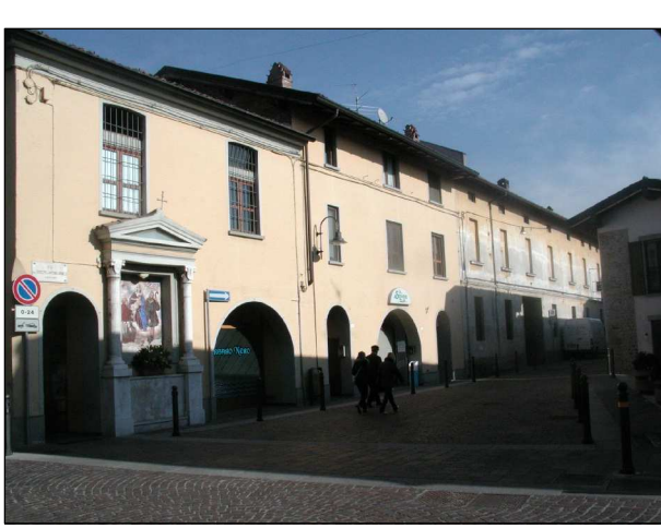
RIFERIMENTO FOTOGRAFICO 21