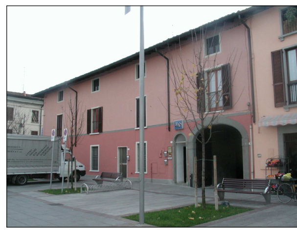
RIFERIMENTO FOTOGRAFICO 10