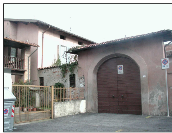
RIFERIMENTO FOTOGRAFICO 13