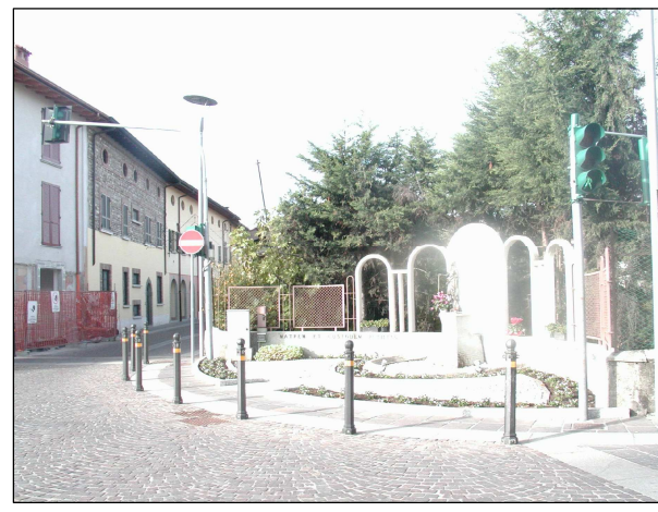
RIFERIMENTO FOTOGRAFICO 6