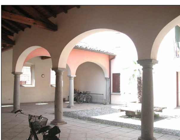
RIFERIMENTO FOTOGRAFICO 16