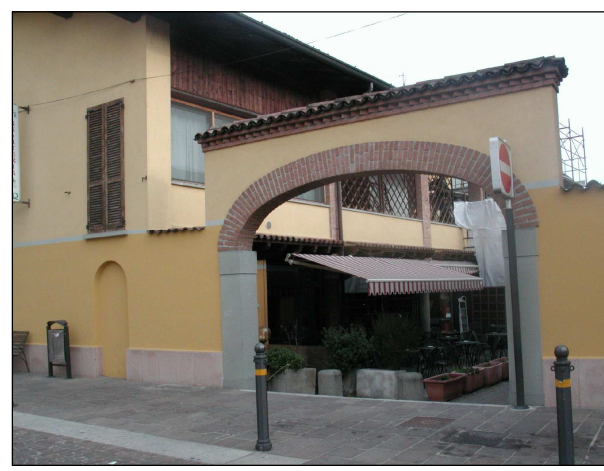
RIFERIMENTO FOTOGRAFICO 9