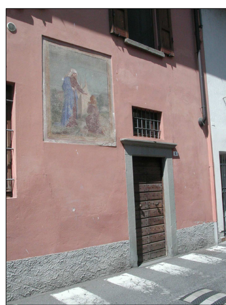
RIFERIMENTO FOTOGRAFICO 15