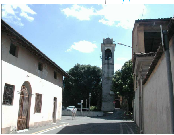
RIFERIMENTO FOTOGRAFICO 3