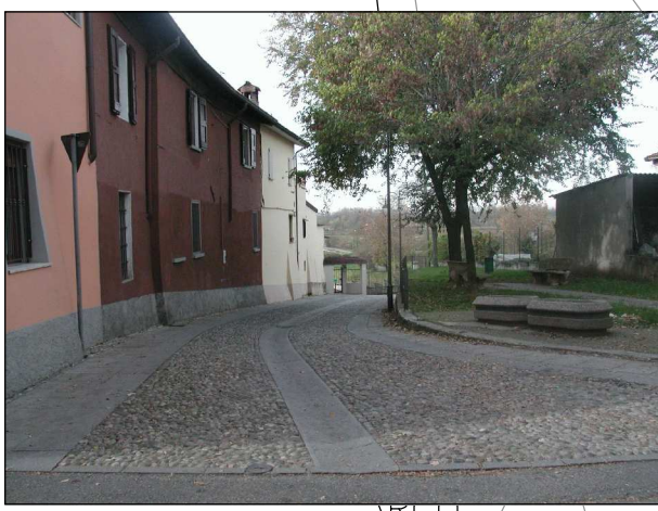
RIFERIMENTO FOTOGRAFICO 5