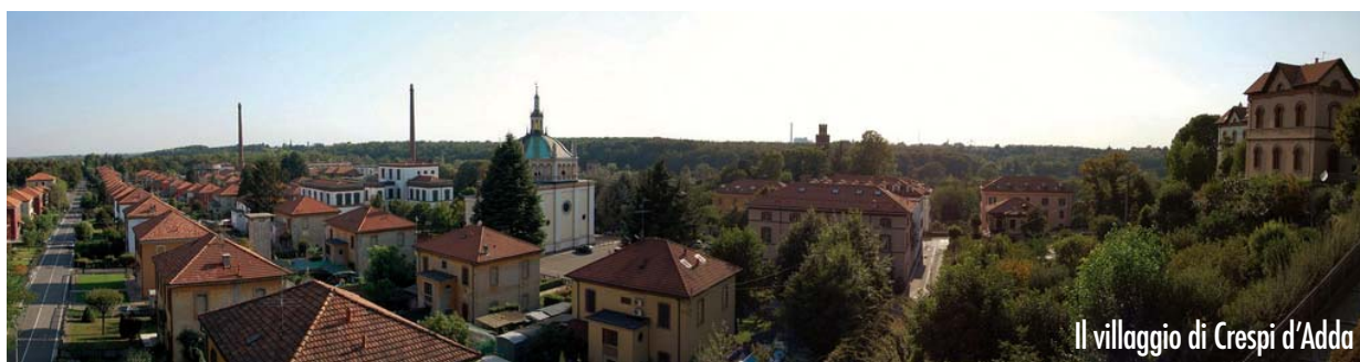
Il villaggio di Crespi d'Adda