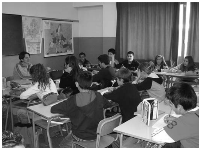
Scuola media classe II