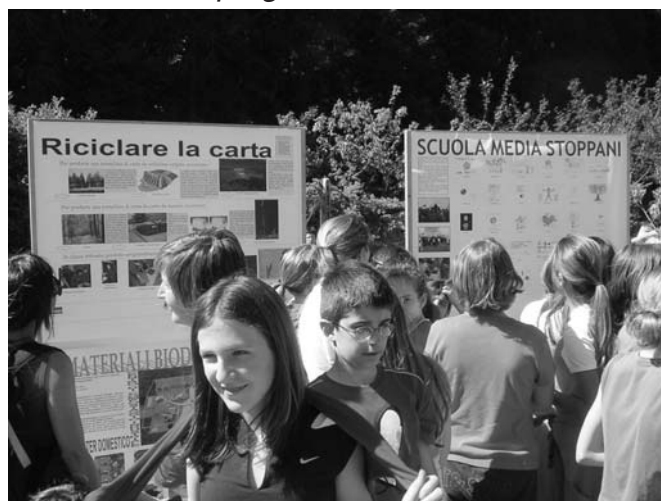
Progetto educazione ambientale

Nel corso dell'a.s. 2004/2005 il Comune ha dato piena attuazione al relativo Piano ed ha messo in atto anche altre significative azioni in esso non previste e per le quali si è assunto l'onere organizzativo e finanziario. Tra gli interventi comunali più significativi ricordiamo l'erogazione di un contributo straordinario di 10.000 euro alla scuola materna parrocchiale in aggiunta ai 21.500 euro previsti e, per quanto riguarda la scuola elementare e media, il progetto di educazione ambien-