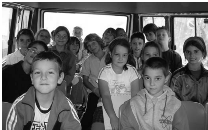
Bambini delle elementari nello scuolabus.

Il servizio viene effettuato con personale e mezzo comunale. Viene confermata la vigilanza sullo scuolabus da parte dei volontari del