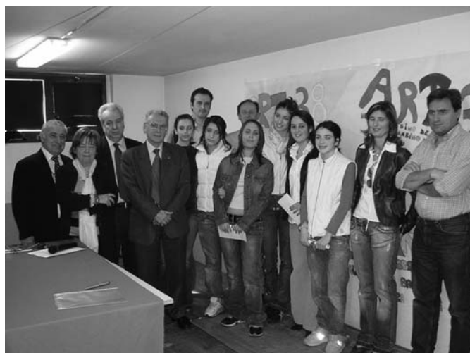
Borse di studio scuola media

nell'anno scolastico 2003/2004 (3 borse di studio per alunni residenti che hanno ottenuto il giudizio di “ottimo” e 2 con “distinto”).