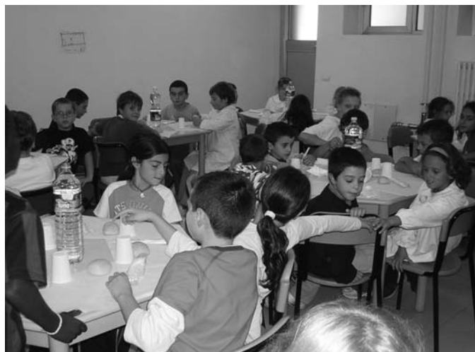
Mensa scuola elementare

rispondenti alle esigenze anche future della popolazione scolastica. A seguito di un notevole aumento di alunni della scuola elementare che frequentano la mensa scolastica, la stessa comincia ad avere alcuni problemi di capienza. Quest'anno per la prima volta si sta valutando l'utilizzo della mensa scolastica anche per gli alunni di prima e seconda media a seguito di un