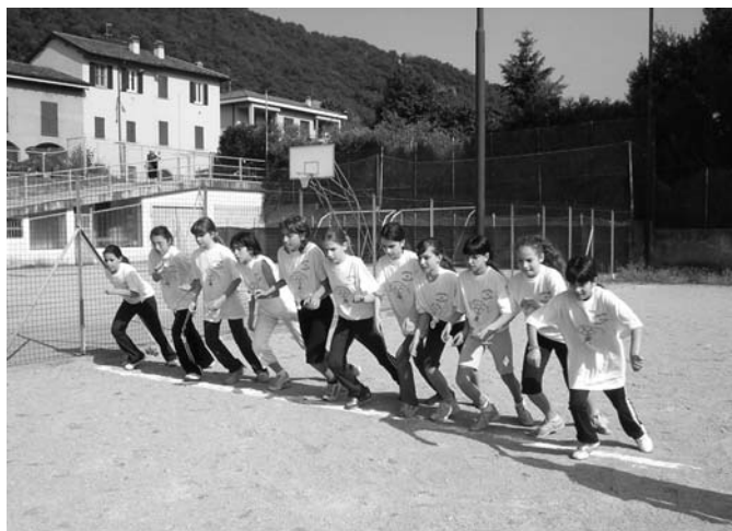
Giochi della Gioventù

Per la mensa il costo del buono pasto sarà pari a 3,76 euro.