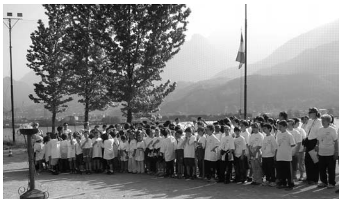
Giochi della gioventù