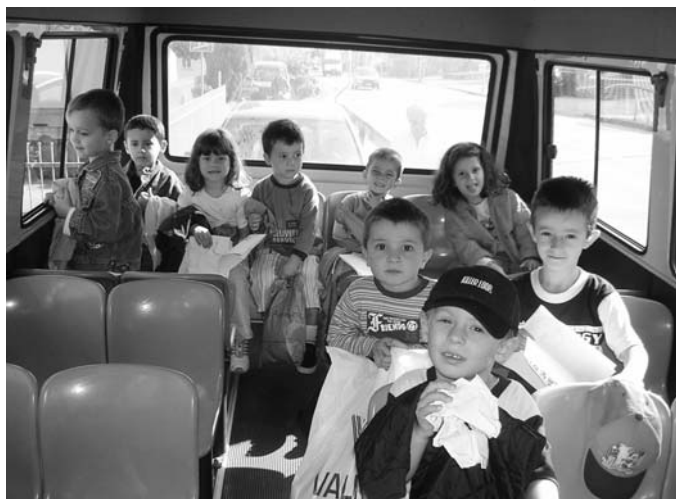
Bambini della materna nello scuolabus

L'Amministrazione Comunale ben conscia del servizio che la Scuola Materna, gestita dall'Ente religioso privato, offre alla popolazione, dà attuazione alla convenzione che regola i rap-