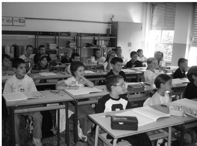
Scuola elementare classe IV