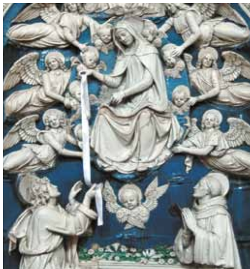
Andrea della Robbia (1435-1525), attr. Madonna della cintola con s. Leonardo e s. Tommaso 1502 Foiano della Chiana, Collegiata dei Ss. Martino e Leonardo