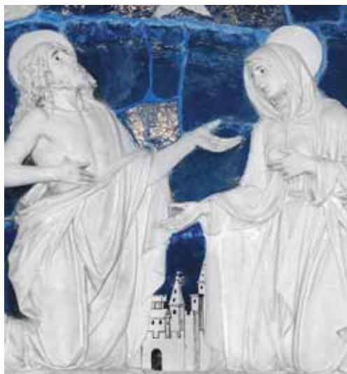
Andrea (1435-1528) e Giovanni della Robbia (1469-1529/30) Gesù e la vergine intercedono presso l'Eterno per il Castello di Foiano 1495-1500 Foiano della Chiana, Chiesa di S. Francesco