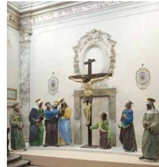
Fra Ambrogio della Robbia (1477-1527) La Crocefissione 1515 ca. Foiano della Chiana, Chiesa di S. Francesco