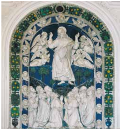
Andrea (1435-1528) e Giovanni della Robbia (1469-1529/30) Ascensione di Gesù 1495-1500 Foiano della Chiana, Chiesa di Michele Arcangelo