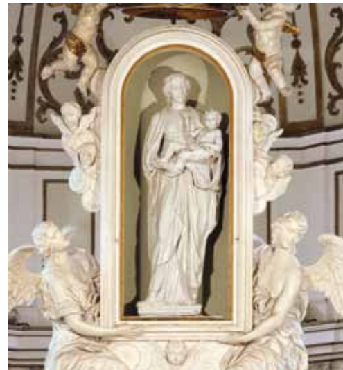
Andrea della Robbia (1435-1528) Madonna col bambino 1460 ca. Foiano della Chiana, Chiesa di S. Maria della Fraternita