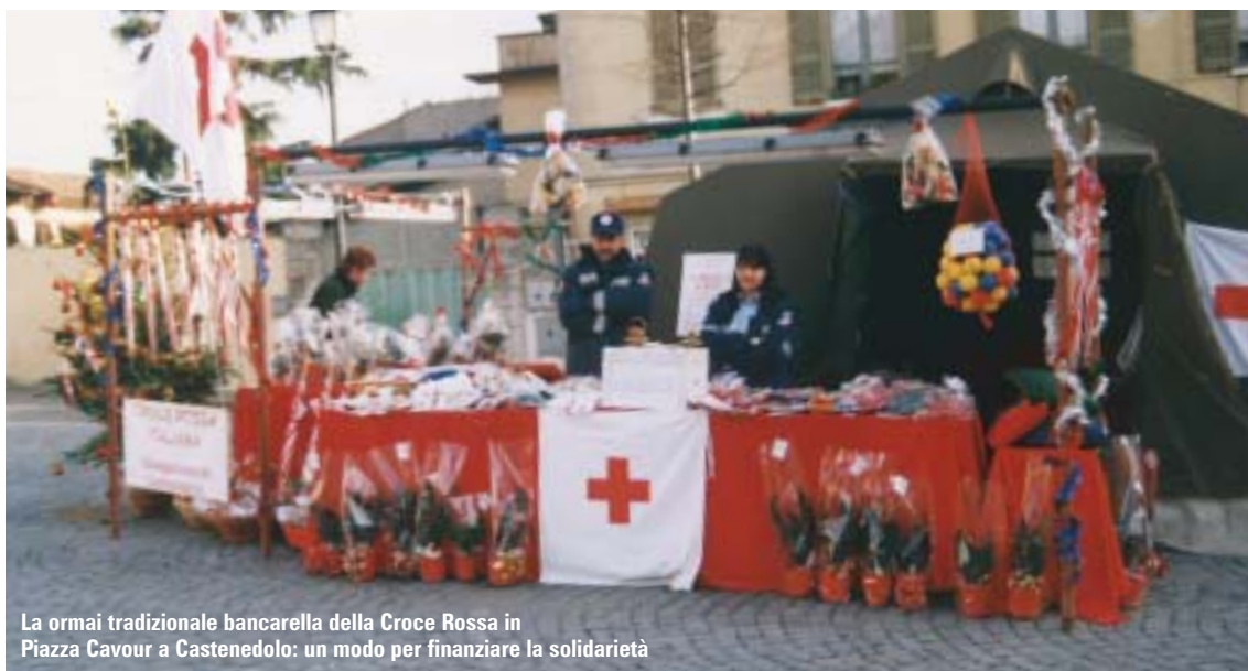
La ormai tradizionale bancarella della Croce Rossa in Piazza Cavour a Castenedolo: un modo per finanziare la solidarietà

Qui a Castenedolo l'ACLI è stata fondata nel 1955 e l'anno prossimo festeggeremo il cinquantesimo anno di fondazione. L'associazione è nata per iniziativa della chiesa come patto associativo tra i la-