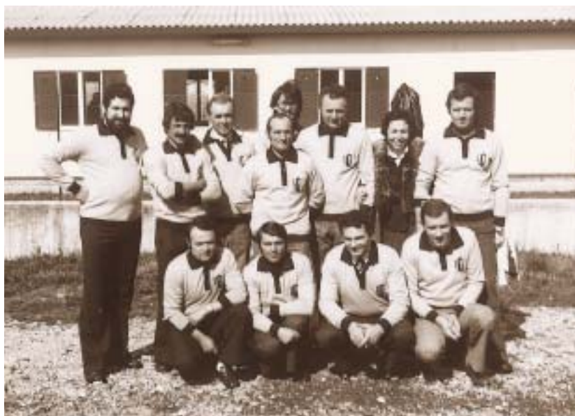
Nella foto: I membri del primo consiglio della Bocciofila Enrica (1975).